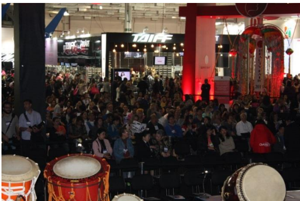
ブラジルの若い方々で超満員でした