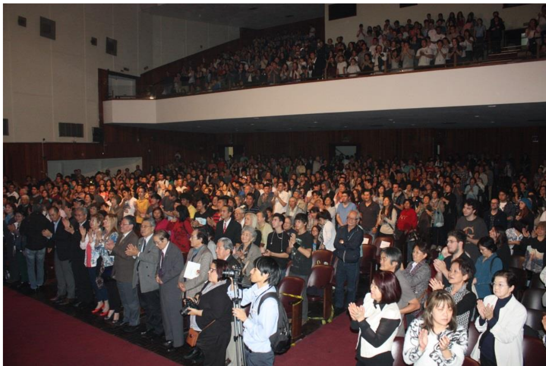
サンパウロ文教大講堂は大入り満員でした 終了後皆さん総立ちの拍手です