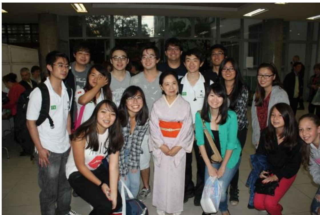
公演終了後の日系の方々と理事長です