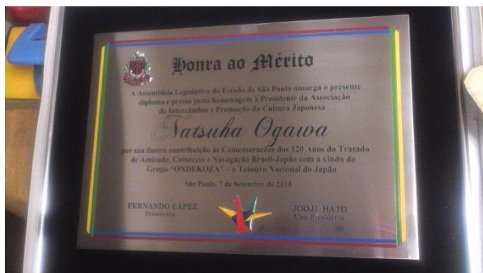
サンパウロより感謝状(額)をいただきました

サンパウロの寄付です 観客の方々が入場が無料でした のでそれぞれ持ってこられました 1500以上の数があり福祉団体4 団体に分けられました これは新聞にも載りました