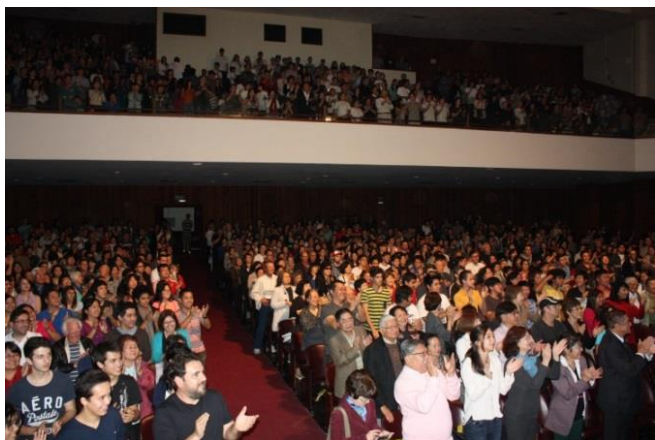
サンパウロ文教大講堂