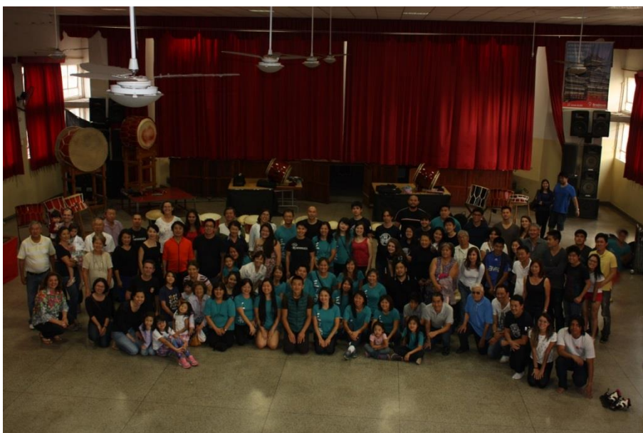
カンピーナス周辺の和太鼓グループで、 ワークショップに参加された方々です