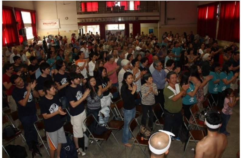
カンピーナス公演終了後 総立ちで拍手して下さいました